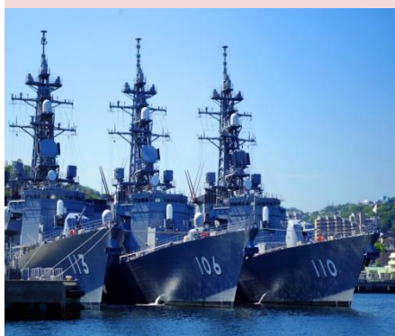
人気のYOKOSUKA軍港めぐり