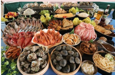
1日目昼食: 海鮮浜焼き