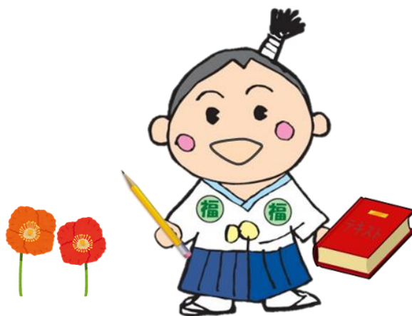
ふくしんぼうし (人材センターマスコットキャラクター)

福祉専門職の皆様の着実なステップアップを目指して、各組織で中・長期的視野に立った人材育成のための研修計画の作成に、「研修スマイルブック」をお役立てください。