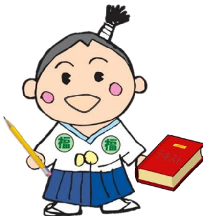
ふくしんぼうし (人材センターマスコットキャラクター)

福祉専門職の皆様の着実なステップアップを目指して、各組織で中・長期的視野に立った人材育成のための研修計画の作成に、「研修スマイルブック」をお役立て下さい。