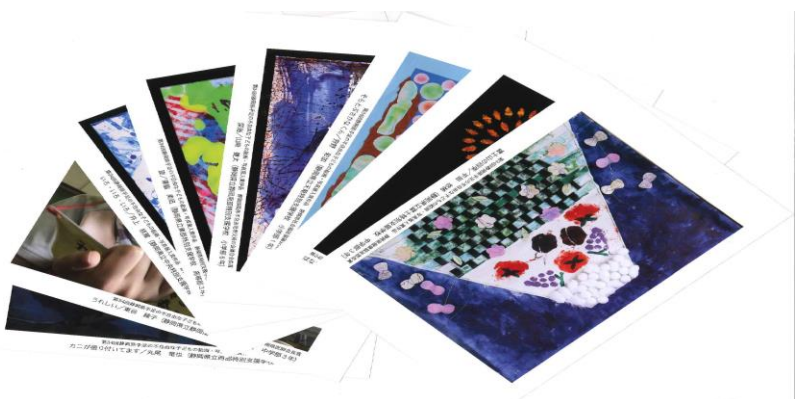
◆ポストカード（8枚セット） 200円