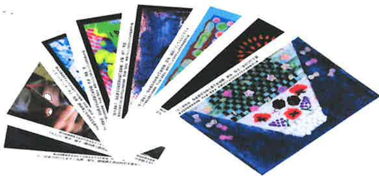
◆ポストカード (8枚セット) 200円