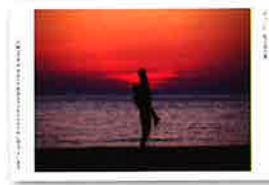
「だっこ」 松江 丞の進

僕の住む神津島は、海岸の夕日がとても綺麗な所です。ある日、海岸を散歩していたとき、父が妹を「だっこ」したので、その瞬間を写真に収めました。