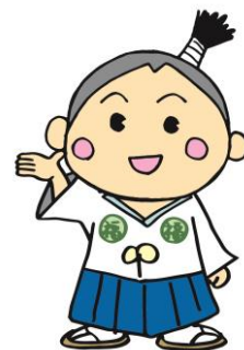
静岡県社会福祉人材センターの イメージキャラクター「ふくしんぼうし」