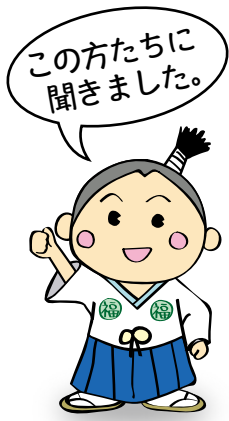
静岡県社会福祉人材センター イメージキャラクター「ふくしんぼうし」

現在、EPA外国人介護福祉士として県内で働く外国人の方と受入れ事業所の方にお話しを伺いました。