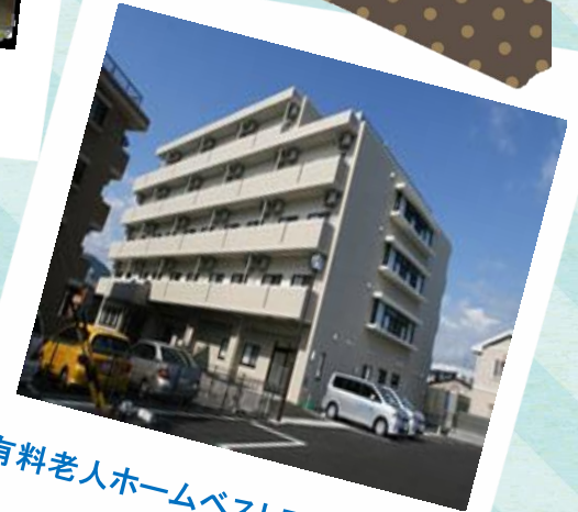
有料老人ホームベストライフ静岡葵