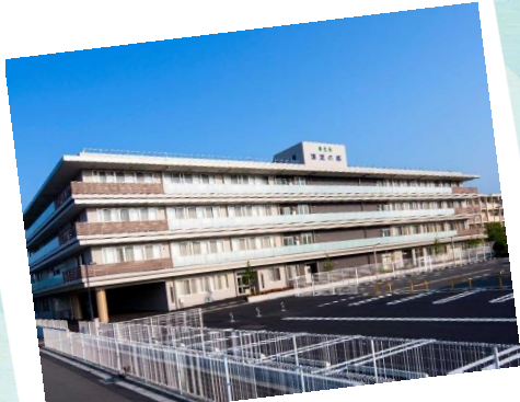
特別養護老人ホーム厚生苑清流の郷