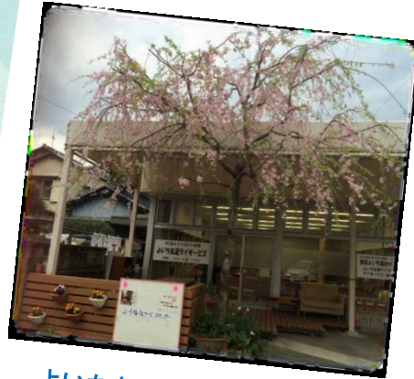
よいち友遊デイサービス