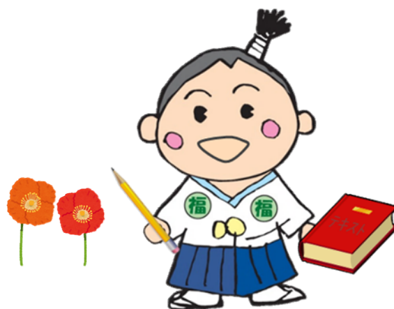
ふくしんぼうし (人材センターマスコットキャラクター)

福祉専門職の皆様の着実なステップアップを目指して、各組織で中・長期的視野に立った人材育成のための研修計画の作成に、「研修スマイルブック」をお役立てください。