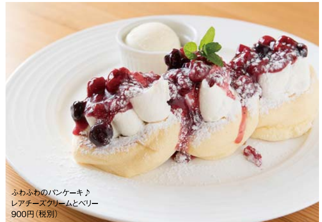
ふわふわのパンケーキ レアチーズクリームとベリー 900円(税別)

社会福祉法人八生会が運営するコミュニティカフェ。カフェの営業だけでなく、ワークショップやサロン、「こども食堂」を開催し、多世代交流や居場所作りもしています。看板メニューのパンケーキは思わず笑顔になる柔らかさです!