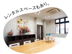
レンタルスペースもあり。