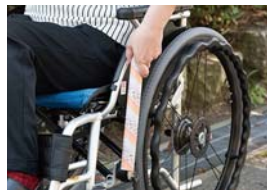
サララップの芯が活躍!

車いすのブレーキレバーにサララップの芯をかぶせると、手が届きやすく、弱い力でも動かしやすくなって、操作が楽に。マスキングテープやシールで飾り付けて楽しく使っている人もいますよ。