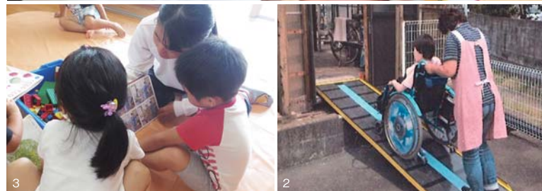
1.高齢者の孤立を防ぐための高齢者サロン((福)松崎町社会福祉協議会) 2.障害者が働く施設に避難用スロープを設置(富士市の就労継続支援B型事業所「竹の子」) 3.福祉の心を育む、夏休みボランティア体験((特非)静岡県ボランティア協会)