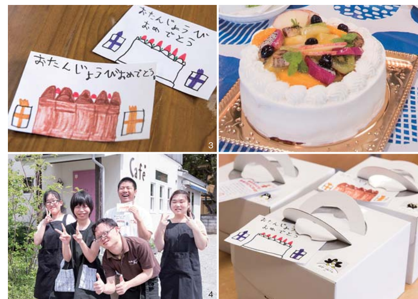
1.商品のケーキはこちら。2.3.手描きバースデーカードも添えて。4.カフェアルテで働く皆さん。