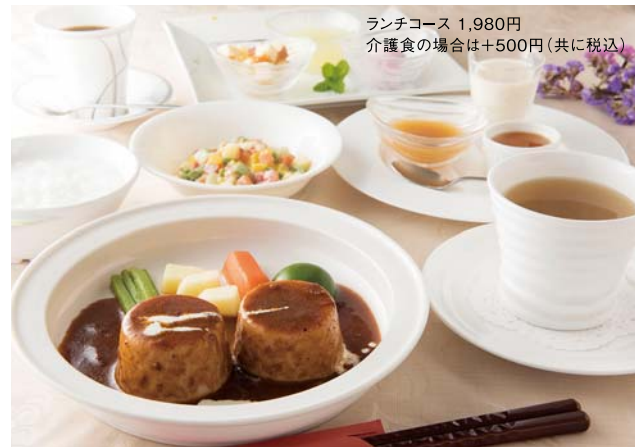
ランチコース 1,980円 介護食の場合は+500円(共に税込)

食事制限がある方も料理や味と一緒に楽しめるようにと、手間を掛けた介護食を提供。同じ食材をペースト状にして食べやすくし、彩りや食感ではできる限り再現するように工夫しています。`ゼリー食のフランス料理、として人気。県外からもお客さんが訪れるそうです。