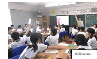
魅力発信「福祉のごとく」