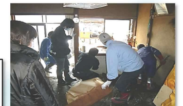
災害時には社協をあげて全力支援