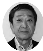
南伊豆町 民生委員児童委員協議会