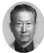
焼津市 民生委員児童委員協議会