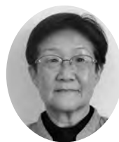
裾野市 民生委員児童委員協議会