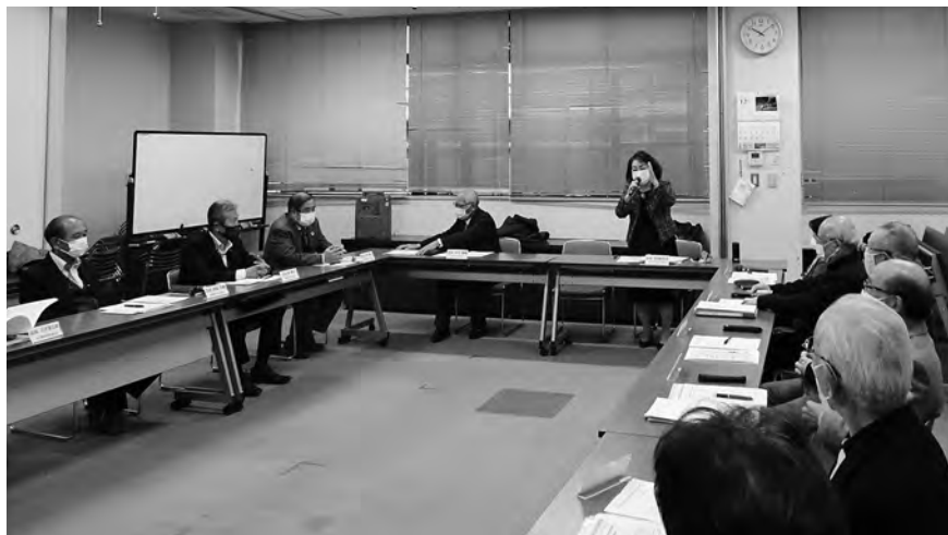
自治会連合会と民生委員児童委員協議会による合同役員会議

民生委員児童委員は、今までも市から提供された情報に基づき、対象者を訪問し調査を行っていました。が、これにより、新たに情報の共有が可能になり、市では、知り得なかつた個人の様子を得ることができ、民生委員児童委員は対象者との信頼関係が一歩前進し、活動しやすくなりました。