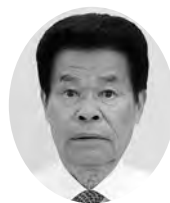
袋井市 民生委員児童委員協議会