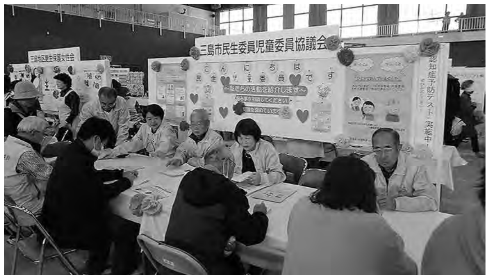
市民すこやかふれあいまつり

それに伴い、個人情報の保護に関する法律が改正され、市町村が名簿に必要な範囲で、個人