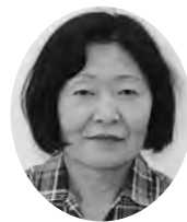
西伊豆町 民生委員児童委員協議会