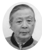
伊東市 民生委員児童委員協議会