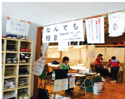
なんでも相談コーナー