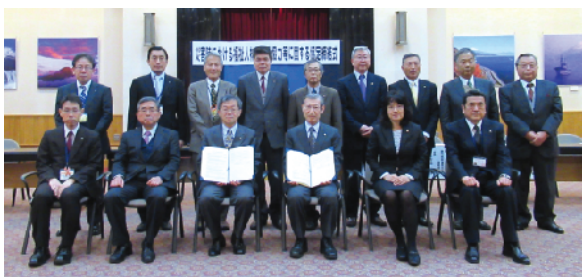
静岡県との「災害時における福祉人材の派遣協力等に関する協定締結式」(平成29年3月29日)

静岡DWATの派遣は、被災市町から静岡県を通じての派遣要請が原則となることから、派遣が円滑に行われることを目的に静岡県とネットワークの間で協定を締結しています。