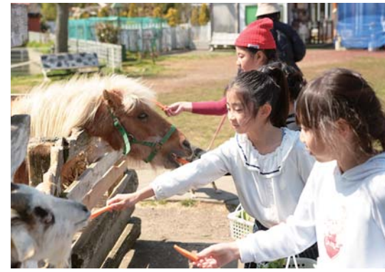
令和2年度 酪農王国株式会社 優秀賞