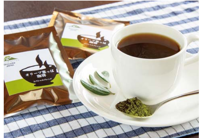
美肌効果も期待できます!

自分たちで栽培するオリーブを使った商品を販売。「オリーブ葉っぱ珈琲」は、1枚1枚摘み取った葉をパウダー状にし、コーヒーとブレンドしてドリップバッグに。ポリフェノールたっぷり、スッキリとした飲み口が特徴です。収穫した実を24時間以内に搾油したオリーブオイルも販売しています。