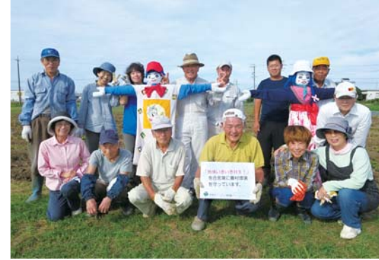
令和2年度 「地域いきいき共生」 恩地町環境みどり会 優秀賞