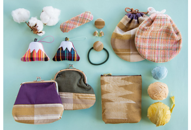
人気の富士山ストラップは中が綿花、裏がフリースの携帯クリーナー。

最近では農福連携も考え、綿花を栽培して綿として活用したり、糸を自然由来のお茶や藍の生葉などで染めて織物にすることもしているラポール安倍川みろく。綿の他、絹や羊毛などの天然の素材を使い、織りのプロに伝授された手法で丁寧に作られた製品の数々に人気が集まっています。