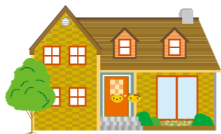
保育所、児童福祉施設