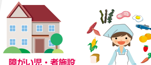
障がい児・者施設

栄養士は、福祉施設、病院などで利用者にあわせた栄養や食生活の改善、アドバイス、調理などを行います。 栄養士、管理栄養士、調理員