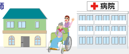
高齢者福祉施設、病院

看護師は病院のほか、社会福祉施設、在宅サービスの事業所で、からだや心の悩みの回復をお手伝いします。 看護師