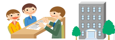
福祉事務所、社会福祉協議会

一人ひとりの悩みを聞き、課題解決に向けて計画をつくり実行します。 社会福祉士、生活相談員、 ケアマネージャー、生活支援員、 ボランティアコーディネーター