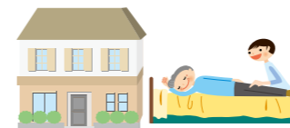
リハビリテーションセンター

福祉施設やリハビリ施設などからだの機能に障がいのある方に対し、からだの機能回復を図り、社会復帰をサポートします。 理学療法士、作業療法士