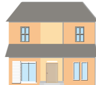
在宅高齢者のお宅

高齢者や障がいのある方の生活をサポートします。 介護福祉士、 介護職員、訪問介護員、 ケアワーカー