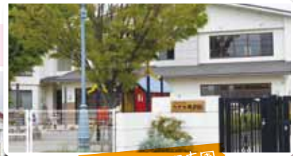
隣のなごみ保育園