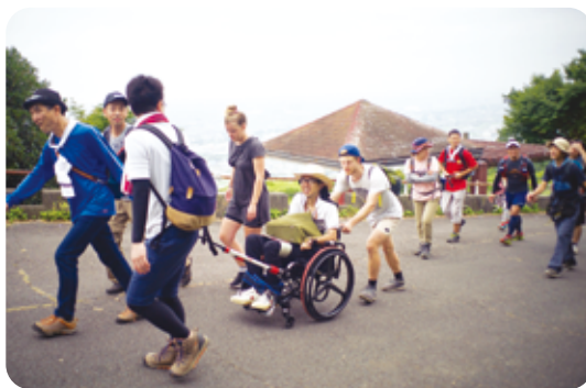
サポートメンバーと楽しく高草山登山