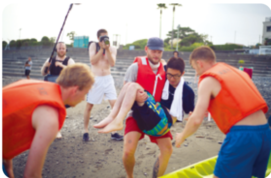
障がいがあっても念願のカヌーにチャレンジ

これからもHyggeは「福祉」だけにとらわれず、幅広い視野での交流やネットワークづくりを通じ、誰もが幸せに暮らせるまちづくりを目指します。