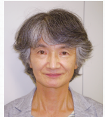
静岡県里親 連合会 会長