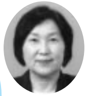
湖西市民生委員児童委員協議会