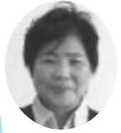
掛川市民生委員児童委員協議会