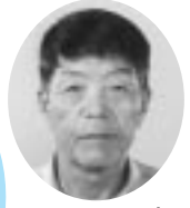
川根本町民生委員児童委員協議会