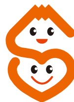
福祉のまちづくり県民運動のシンボルマーク

このシンボルマークは、静岡の英文頭文字「S」をモチーフに、「富士山」と福祉のシンボル「ハート」を用いて「S」の文字を描き、その中に手をつなぎ、笑顔で助け合い、福祉のまちづくりに努力している人を表しています。「 県民福祉の日 」が広く浸透し、 他者へのやさしさと思いやりの心にあふれた静岡県になるように願いが込められています。