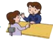
ディナー 福祉協議会